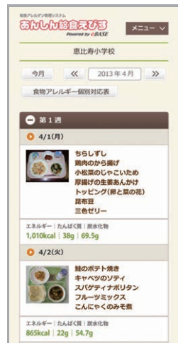
献立表(スマートフォン)