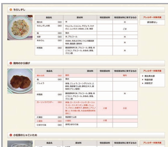
献立詳細アラート表示(パソコン)