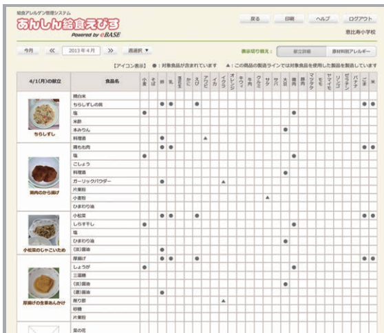
原材料別アレルギー一覧(パソコン)