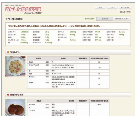
献立詳細(パソコン)